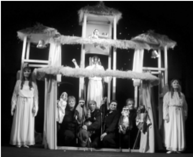
“Різдвяна колицька” Б. Бойко. Режисер-постановник – С. Єфремов, художник – В. Безуля. Київський міський театр ляльок.