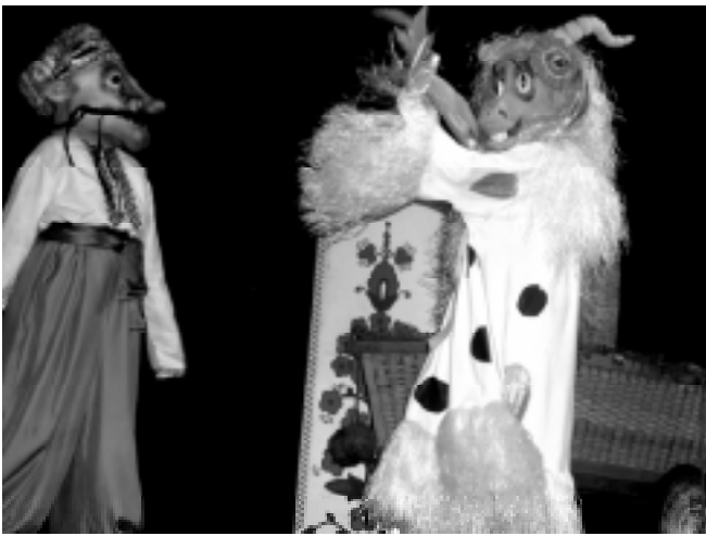
“На Різдво, підвечір...” . Автор сценарію і постановник – О. Кузьмин, художник – А. Курій. Черкаський обласний театр ляльок.

значить – має бути конкурентноспроможною на ринку інших масових дитячих товарів: комп’ютерних ігор, ляльок Барбі, коміксів... Вистава курганців у цьому сенсі – поза конкуренцією.