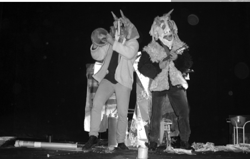
“У Бога за спиною”. Режисер – К. Сікі, ляльки – Д. Ріти Сюч, театр “Арлекін”, м. Егер, Угорщина.

розглянула національну лялькову різдвяну драму (“шопка”) як герменевтичний феномен, визначаючи її і як “синтетичну імітацію міту”, і як своєрідну “контркультуру”. Тема виступу І. Уварової російською мовою звучала як “Всехний младенец”. Традиція сприйняття й тлумачення образу Ісуса Христа як “для всіх народженого” немовляти була розкрита доповідачем крізь призму юнгівської теорії архетипів. Адже “архетип немовляти” – один з найпотужніших у нашому позасвідомому, він в’яже нас із тасмницею власного народження.