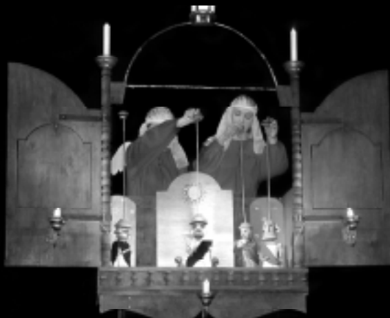
“Меч ангела” І. Сидорука. Режисер – Ю. Саричев, художник – В. Рачковський. Мінський обласний театр ляльок “Батлейка”, м. Молодечно, Білорусь.