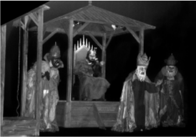
“Вертеп” В. Шевчука. Режисер – В. Феленчак, сценографія – М. Малеша. Театр ім. Г. Х. Андерсена, м. Люблін, Польща.

та, врешті, самознищувальний механізм, пекельні тортури душі, враженої страхом. У цьому прочитанні надзвичайно складний філософський драматичний твір отримав виразне, цілісне, можливо, в чомусь, однозначне, але зрозуміле для широкої глядацької аудиторії сценічне втілення.