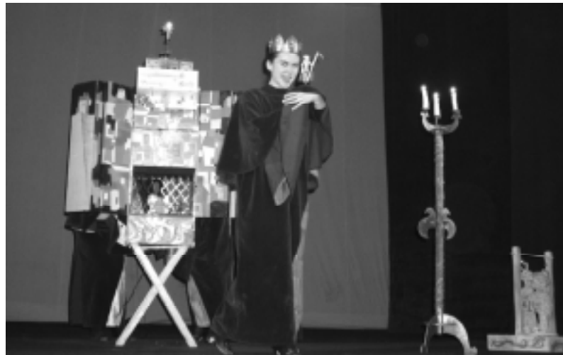
“У трьох королів” . Режисер – Н. Плеханова, художник – Т. Терещенко. Курганський театр ляльок “Гулівер”, Росія.

рисунок персонажа-ляльки, виявляючи то внутрішнє сум’яття Ірода (арія-монолог), то збентеженість царів (тріо). Вистава не ставить собі за мету сягнути “містеріального” таїнства. Вона відверто театральна, її музичний світ – гармонійне поєднання народної різдвяної вокальної традиції з традиціями європейської музично-театральної культури. Цінним у ній, на нашу думку, є